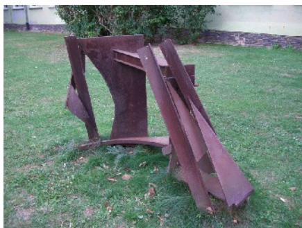
“Speed”, 1981, Stahl, gerostet, gefirnist, 120 x 183, 115 cm, erworben 1989