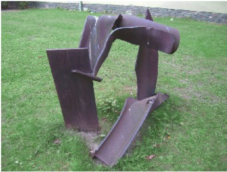
"Gang Bang", 1984, Stahl, gerostet, 130 x 140 x 96 cm, erworben 1989

Klaus H. Hartmann, 1955 geboren in Schwäbisch Gmünd, Ausbildung zum Krankenpfleger, lebt und arbeitet seit 1979 in Berlin