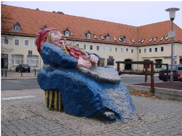
Gemeinschaftsarbeit: Marktfrau "Schölke Jette", Kalkstein bemalt, 180 x 110 x 280 cm, erworben 1987