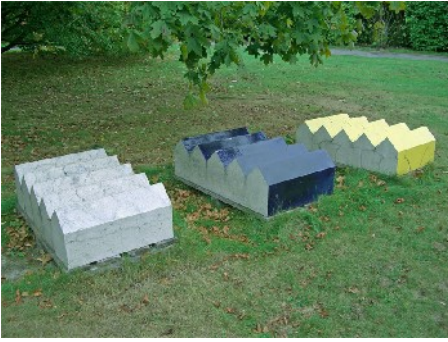
“ohne Titel”, 1991, dreiteilige Keramikarbeit, bemalt, erworben 1992.